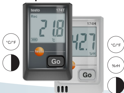
Ambas variantes disponibles en negro o blanco

testo 174 T / testo 174 H con USB-C y software para PC