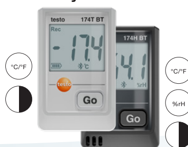
Ambas variantes disponibles en negro o blanco

testo 174 T BT / testo 174 H BT con Bluetooth y conexión a la App