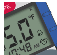
Temporizador de cuenta atrás y alarmas