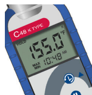
Función de temperaturas Max/Min